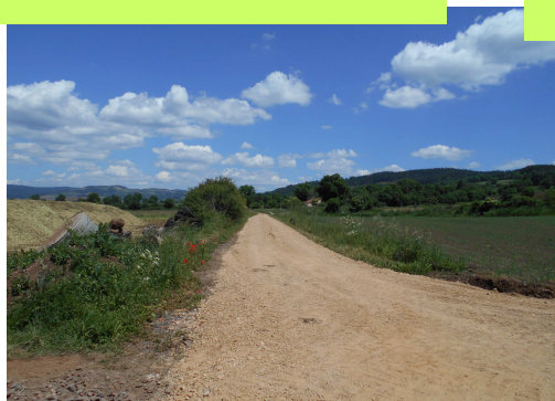
Devant la Maison de la Nature, Parredon