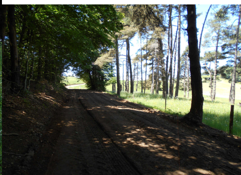
Marais de Limagne: Côté La Veyssyre