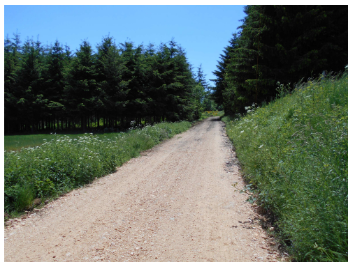
Marais de Limagne-Farges