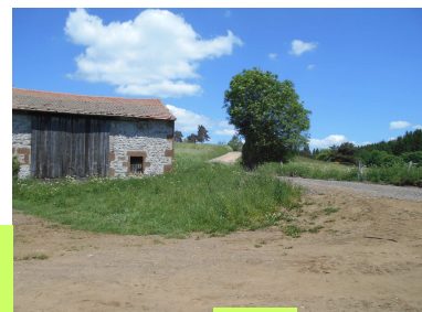
Maison du Lac En direction de Farges